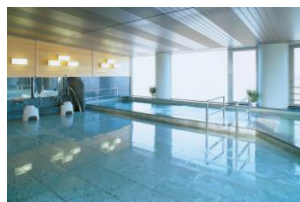
展望大浴場「元気の湯」