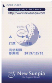
旧リライトカード

リライトカードをお持ちの方は無料でICカードに交換致します。 お手数料をお掛け致しますが、今後とも宜しくお願い致します。