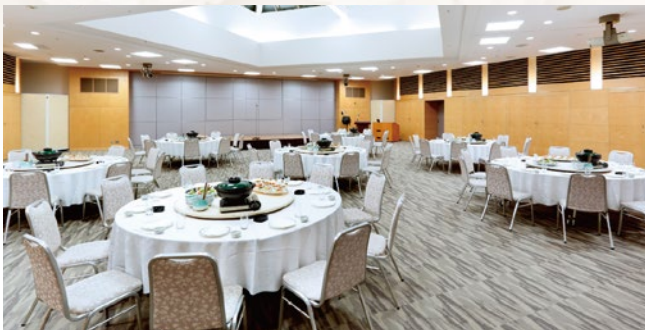
大ホール「赤城」150人・240㎡