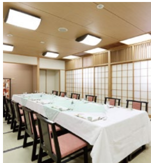
小宴会場「三国」16人・27畳