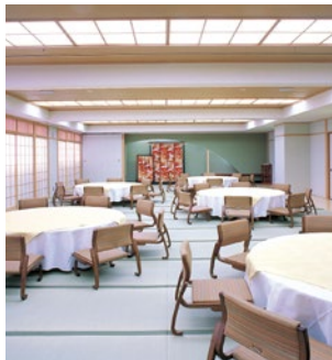
大広間「榛名」70人・72畳