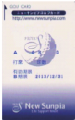
旧リライトカード